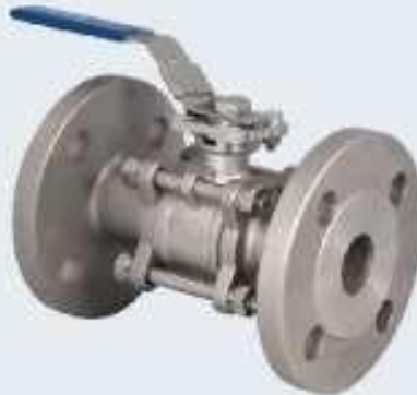
Paslanmaz Küresel Vana