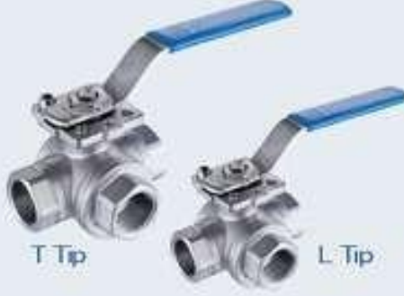
3 Yollu Paslanmaz Vanalar