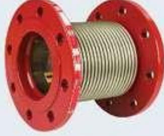
Titreşim Yutucu Metal Kompansatör