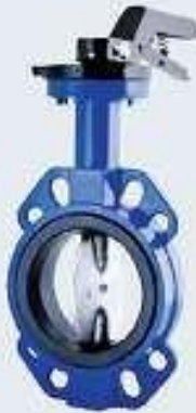
Wafer Tip Kelebek Vana