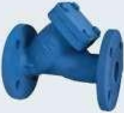
Y Tipli Pislik Tutucu