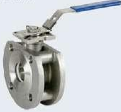
Monoblok Paslanmaz Vanalar