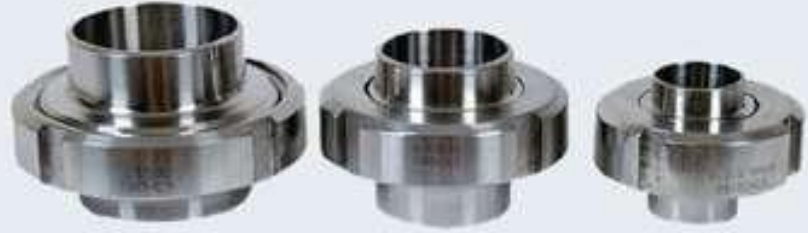
Paslanmaz Ay Anahırlı Redüktörler