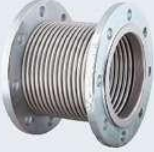
Döner Flanşlı Kompansatör