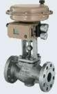
Pnömatik Oransal Vana