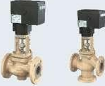
Motorlu Kontrol Vanaları