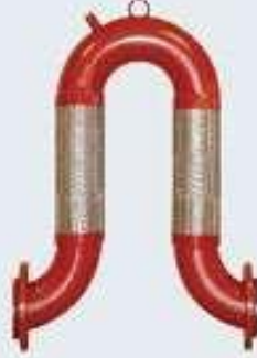
Dilatasyon Omega Bağlantı