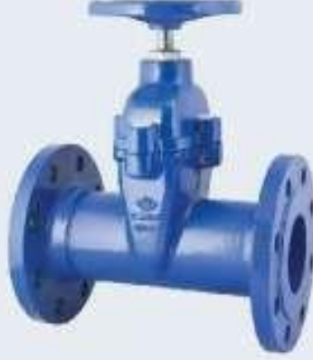
Elastomer Sittli Sürgülü Vana (F5)