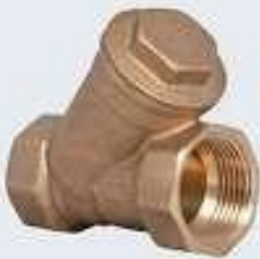
Pislik Tutucu (FN16)