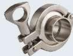
Paslanmaz Klem Kılıpçesi