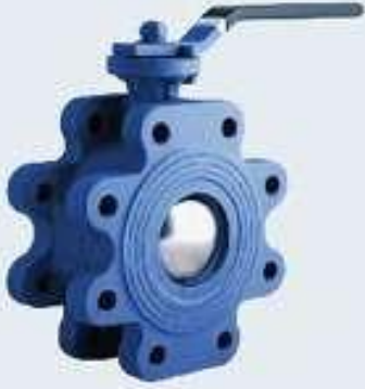
Lug Küresel Vana