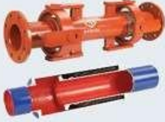
Sismik ve Dıştan Basıncı Kompansatör