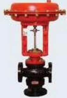
Üç Yollu On-Off Vana