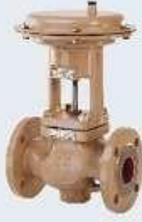
Pnömatik On-Off Vana