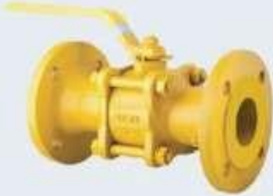
Doğalgaz Küresel Vana