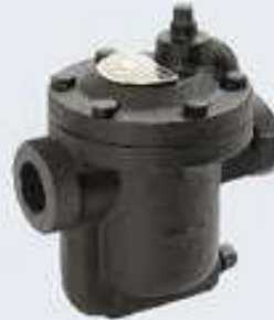
Ters Kovalı Kondenstop