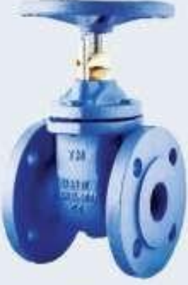
Elastomer Sittli Sürgülü Vana (F4)