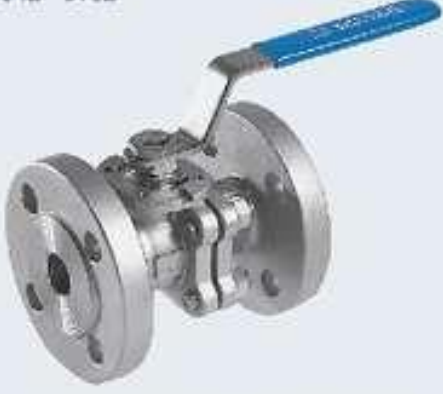
2 Parçalı Paslanmaz Flanşlı Kollu Vanalar