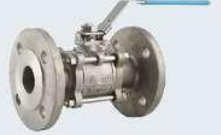
3 Parçalı Paslanmaz Flanşlı Kollu Vanalar