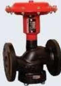
İki Yollu On-Off Vana