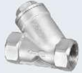
Paslanmaz Pislik Tutucular