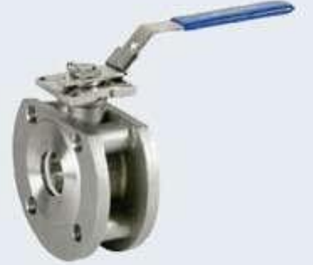
3 Parçalı Paslanmaz Vanalar