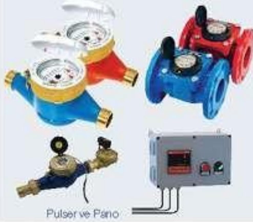
Pulsör ve Fano