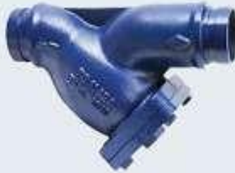
Yırtl Pislik Tutucu