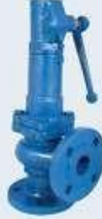
Oransal Kalkışlı Emniyet Ventili (Yaylı / Ağırlıklı)