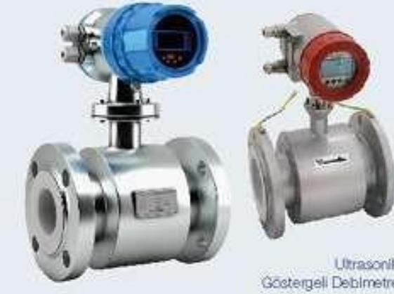
Ultrasonik Göstergeli Debimetre