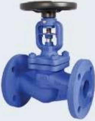
Metal Körüklü Vana