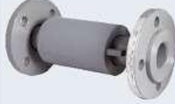
Dıştan Basıncı Kompansatör