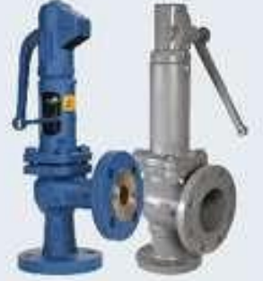
Tam Kalkışlı Emniyet Ventili