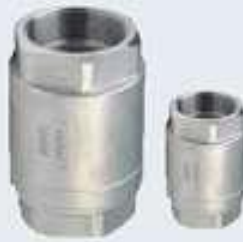
Paslanmaz Dik Çekvalfler