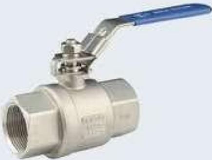
2 Yollu Paslanmaz Vanalar